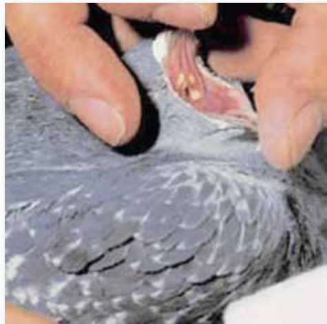
Cúmulo de Tricomonas en forma de botones en la garganta de una paloma que no presenta ningún síntoma.

Transmisión: Los pichones son infestados al ingerir la