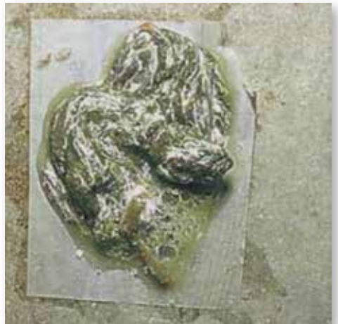
Dejeccions modelades i d'aspecte de clara d'ou, presents al principi d'un trastorn intestinal causat per bacteris o paràsits.

Símptomes: Els símptomes que mostra el colom són abatiment general,